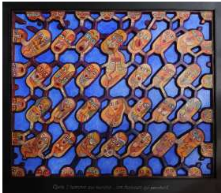
Après l'homme qui marche les hommes qui tombent